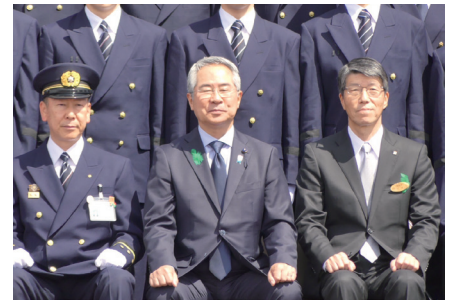
2024.4.4 消防職員初認教育入校式