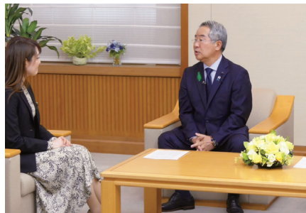
2024.4.5 栃木正副議長就任インタビュー