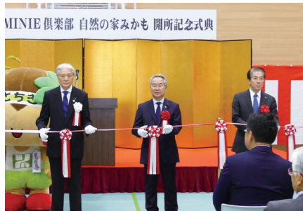
2024.3.20 自然の家みかも 開所記念式典・オープニングセレモニー