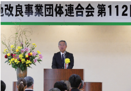
2024.3.25 栃木県土地改良事業団体連合会 112回総会