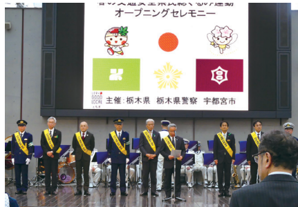
2024.4.4 春の交通安全県民総ぐるみ運動 オープニングセレモニー